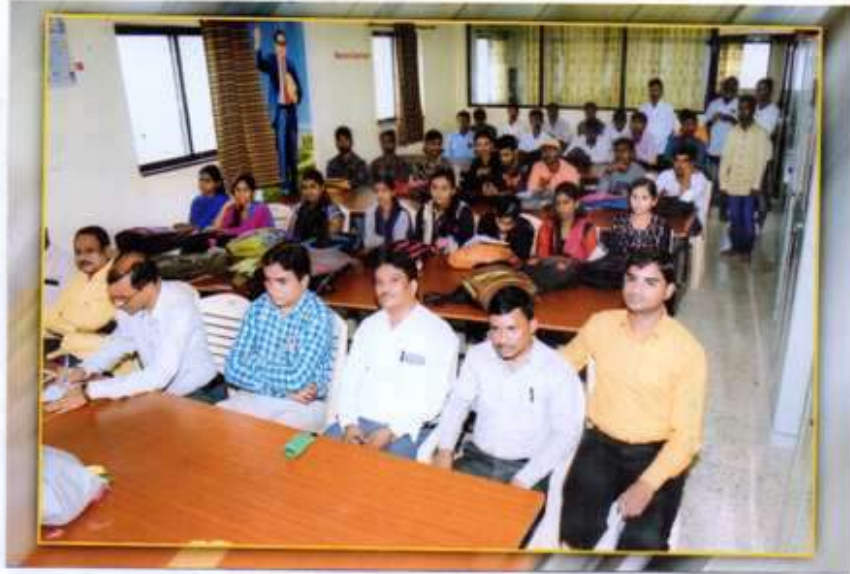
कार्यक्रमाला उपस्थित असलेले महाविद्यालयाचे विद्यार्थी